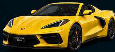
Corvette C8 coupé (490 cv)