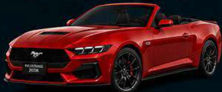
Mustang cabrio (446cv)