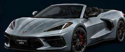
Corvette C8 cabrio (490cv)